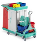
Magic Line 370S