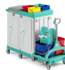
Magic Line 370E